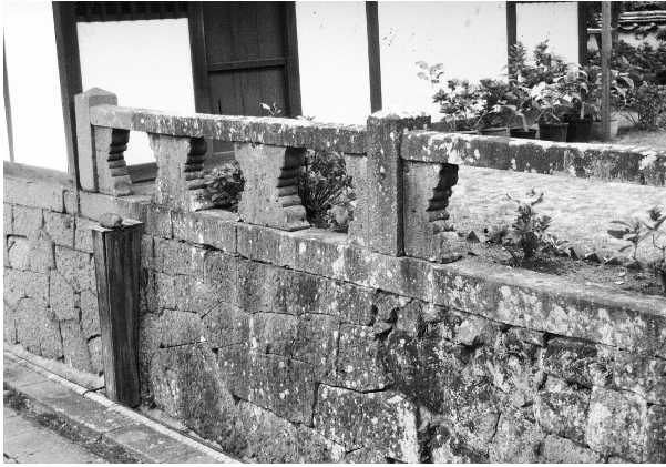
写真5-2-3 興福寺(長崎市)本堂 勾欄部の狭間石