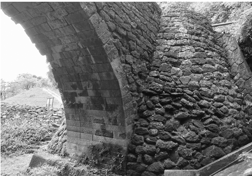
写真5-2-8 雄亀滝橋 2 上流側石台