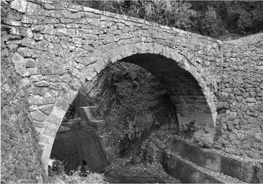
写真5-2-7 雄亀滝橋 1 全景