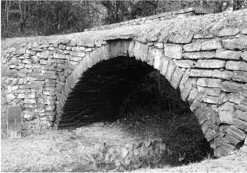
写真5-2-5 早鐘眼鏡橋 1 右岸下流側 袖石垣