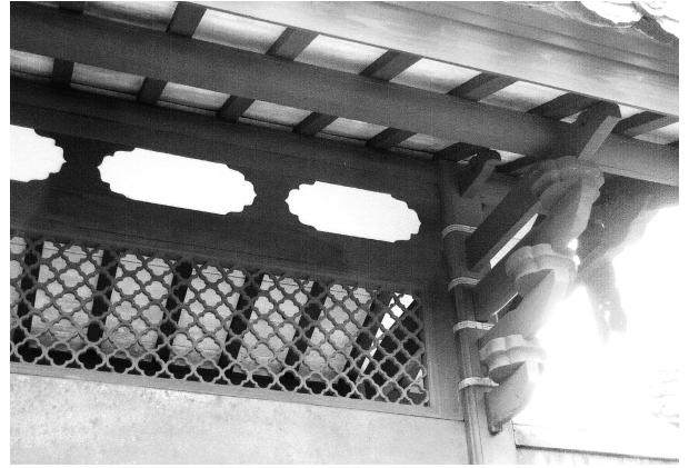
写真5-2-4 欄間と束石の透かし彫りの木型