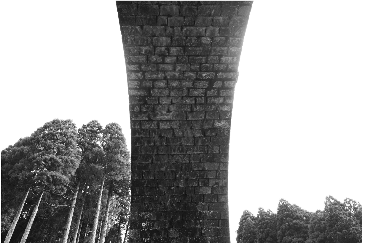
写真13 通潤橋 輪石見上げ写真