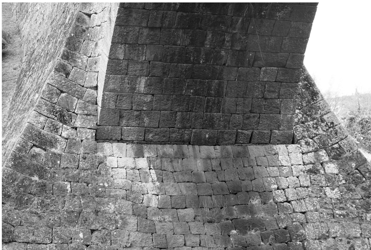
写真16 通潤橋 左岸側 輪石と鞘石垣の取付状況