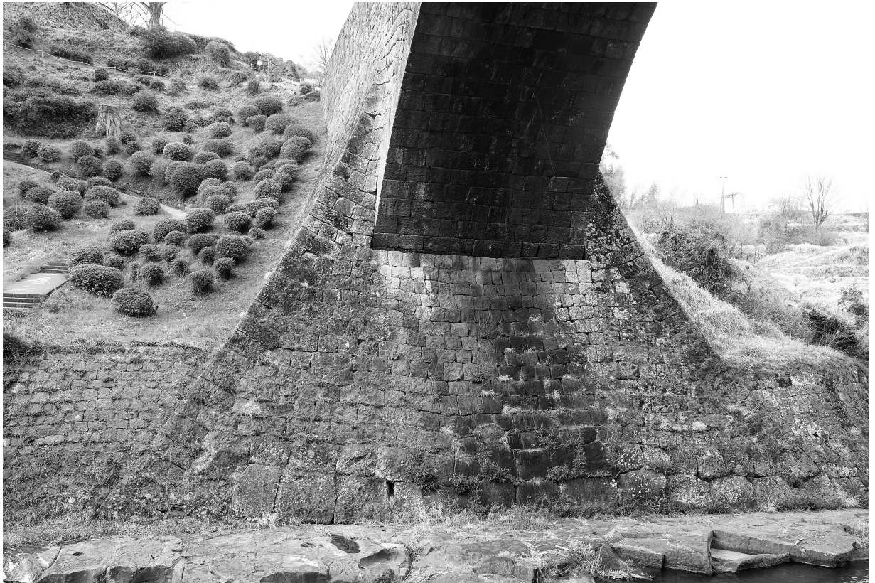
写真14 通潤橋 左岸側 輪石基部と鞘石垣