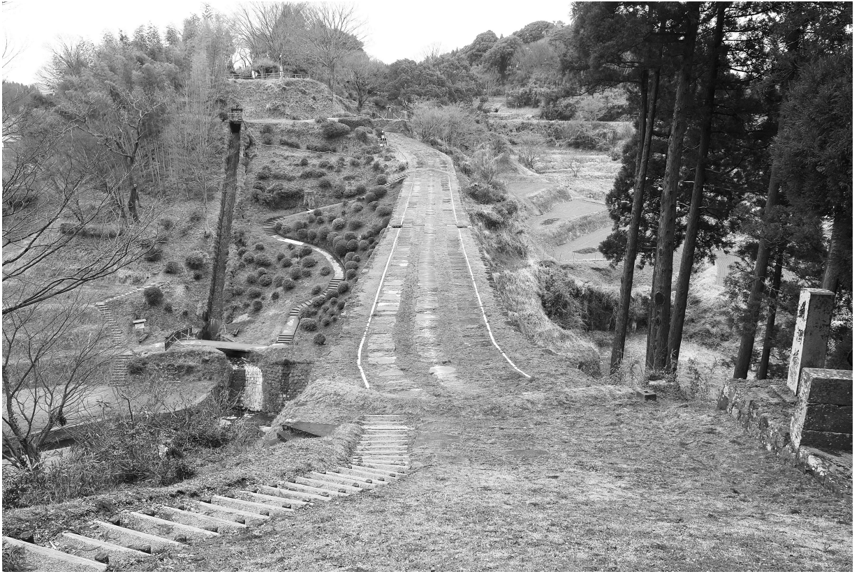
写真33 通潤橋 橋上の現況② (右岸側から左岸側を望む)