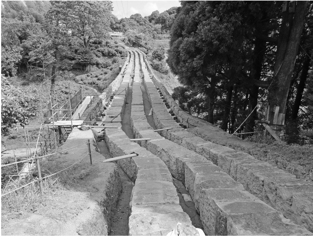
写真35 通潤橋 通水石管列（吹上樋）の検出状況② 全景（右岸側より望む。平成29年度保存修理工事）