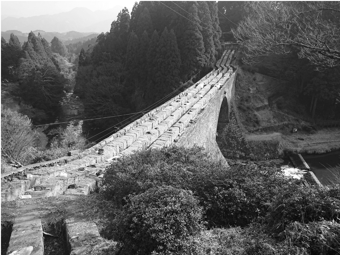
写真34 通潤橋 通水石管列 (吹上樋) の検出状況① 全景 (左岸側より望む。平成29年度保存修理工事)