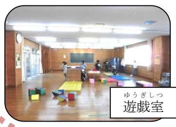
ゆうぎしつ 遊戯室