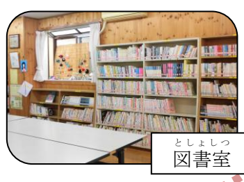
としょしつ 図書室