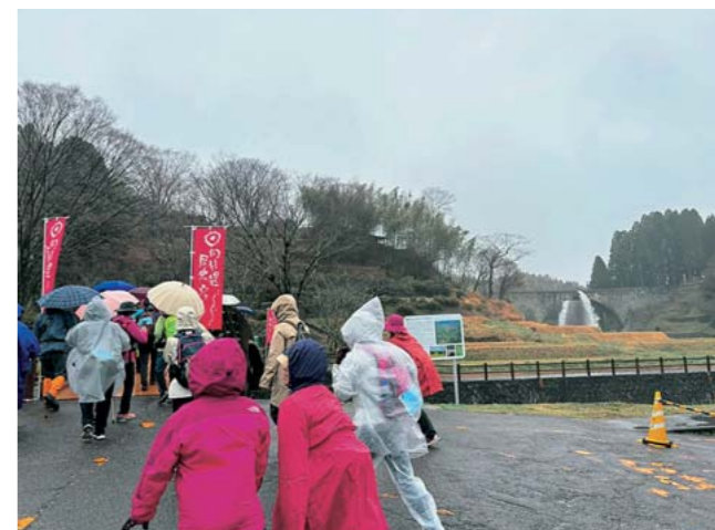
2日目のスタートの様子

2日間を通して、町内外多くの方にご参加いただき、山都町の魅力を感じていただく良い機会となりました。