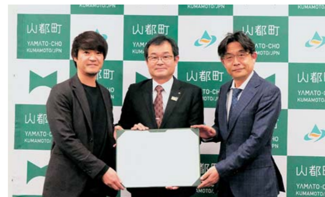
連携協定締結式の様子

3月18日、観光分野でのデジタル化等の取り組みに向けて、株式会社MARUKUと東芝データ株式会社、町の3者による連携協定を結びました。今後は、満足度向上とリピーターやファンの増加による再来訪の促進、消費拡大などに向けて取り組みを進めていきます。そのために観光事業のデジタル化などを進め、町の自然や歴史、文化などの観光資源を活かした魅力発信や情報提供、観光客の利便性向上などを図っていきます。