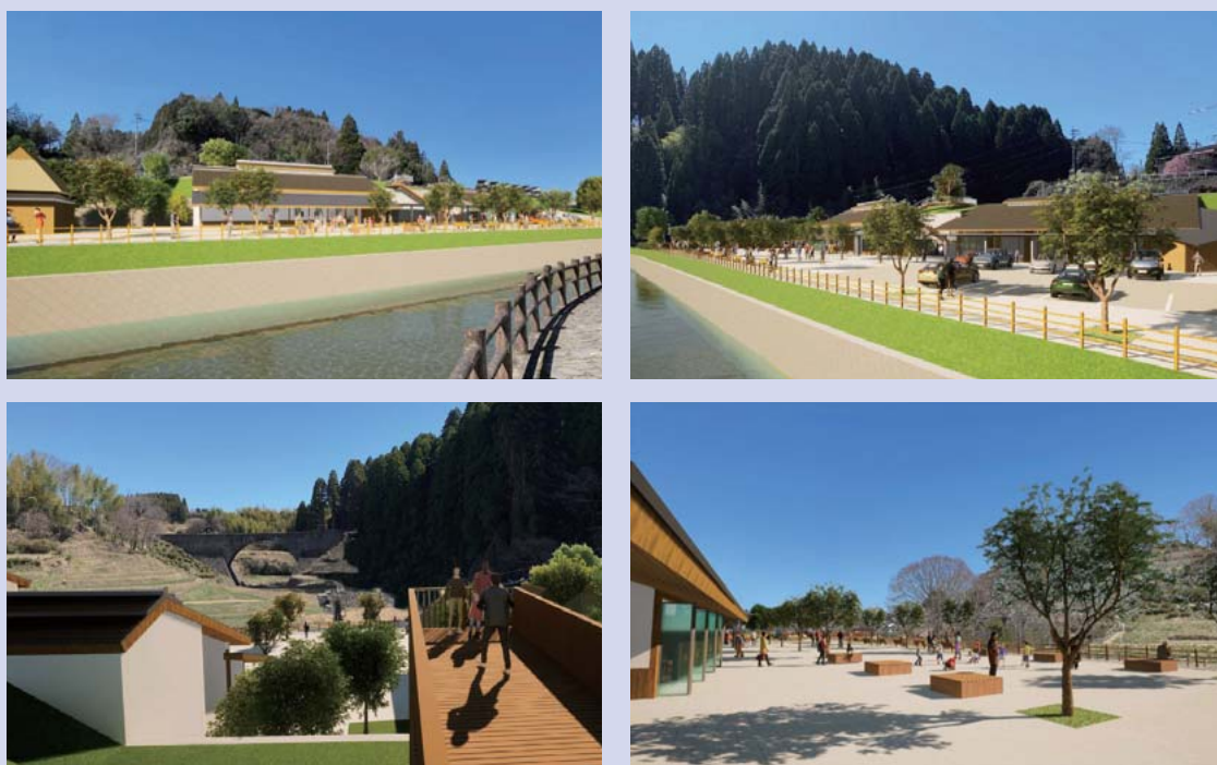
※イラストはイメージです。実際の整備とは異なる場合があります。