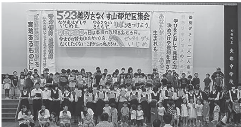
昨年の5・23差別をなくす山都地区集会の様子

日時 5月24日 場所 矢部中学校体育館 時間 午前8時45分から午前11時まで