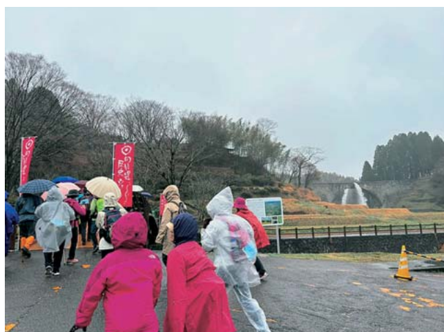
2日目のスタートの様子

2日間を通して、町内外多くの方にご参加いただき、山都町の魅力を感じていただく良い機会となりました。