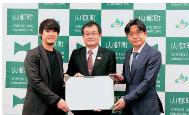
連携協定締結式の様子

3月18日、観光分野でのデジタル化等の取り組みに向けて、株式会社MARUKUと東芝データ株式会社、町の3者による連携協定を結びました。今後は、満足度向上とリピーターやファンの増加による再来訪の促進、消費拡大などに向けて取り組みを進めていきます。そのために観光事業のデジタル化などを進め、町の自然や歴史、文化などの観光資源を活かした魅力発信や情報提供、観光客の利便性向上などを図っていきます。