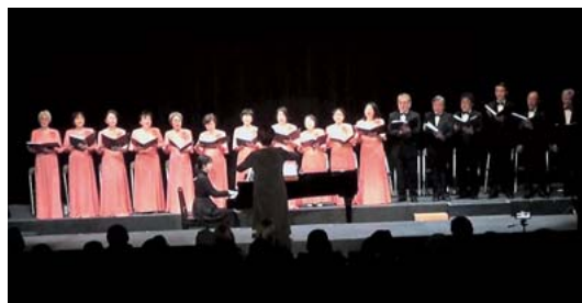
美しいハーモニーを披露する合唱団の皆さん

合唱団のメンバーは「また聞きたいとの声をたくさんいただき、それを励みに頑張ってきました。今後も私たちのハーモニーをお届けできるように頑張ります」と話されました。