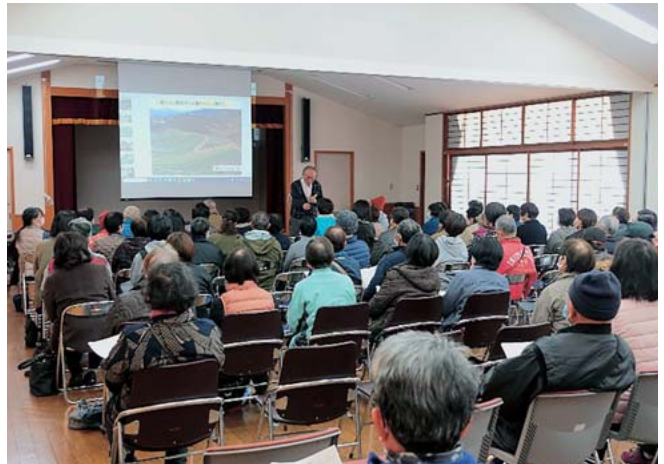
菌ちゃん先生の話熱心に聞く参加者（左：千寿苑、右：清和山村基幹集落センター）