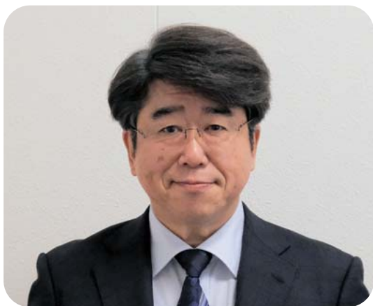
山都町副町長 さかもと ひろし 坂本 浩 (66 歳)