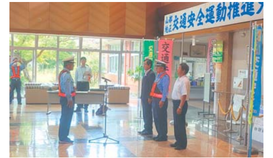
山都地区推進大会でのパトロール出発申告

9月21日から9月30日にかけて、秋の全国交通安全運動が実施されました。町内でも、交通安全運動山都地区推進大会やハーレーパレードキャンペーンなど、様々な交通安全に関する啓発活動が展開されました。活動には、町内の安全運転管理者協議会、自家用自動車協会、トラック協会、二輪車推進協議会、交通指導員、シニアクラブ、矢部高校・矢部中学校の生徒たち、民生児童委員など、多くの方々が参加し、町全体に交通安全を呼びかけました。