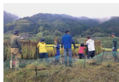
稲刈りと掛け干しの様子