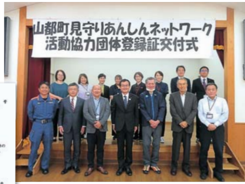
登録証交付式の様子