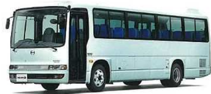
●ボデーカラー/エレガンス (標準仕様) : ライトターコイズ (BUS-8114)

●ボデーカラー・ネイチャー (オプション) : ライトピンク (BUS-8001) 左出ミラー、前面社名表示窓 (LED式スモール点灯)、給油口蓋 横開式 ステンレス巻、 運転席サンバイザー 回転式 (グレースモーク)、メインエンジン火災警報装置はオプション。 ■写真は合成です 掲載写真の外装色、内装色等はカタログ用にCG合成などを使用して作成または撮影したもので、 実際の色と異なって見えることがあります。詳しくは販売会社営業スタッフにお問い合わせください。