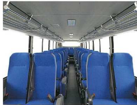
シート高床・エレガンス (ボールドブルー) (標準仕様)