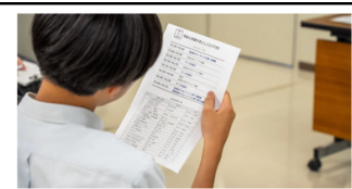
『やまとしごとSTORE』で高校生に伝えたい！山都町で働く大人の本気のエール

多くの自治体で導入されているブログサービス『note』にて、やまとしごとSTOREに関する記事を公開しています。右下の2次元コードから記事を読むことができます。