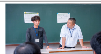
【山都町のおしごと紹介】会社という仕組みを使って、農林業を当たり前の仕事に。『合同会社 笑顔の食卓』