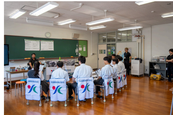
高校の各教室を使って実施