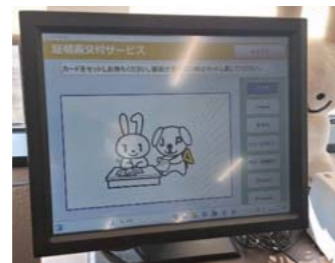
らくらく窓口証明書交付サービス

役場窓口では、マイナンバーカードを活用した「書かない窓口」を推進しています。コンビニ交付と同じ手順で住民票などの証明書が発行できる「らくらく窓口証明書交付サービス」やマイナンバーカードの情報（住所、氏名等）を申請書に転記する「サイバー窓口」を設置し、窓口来庁者の負担軽減を進めています。