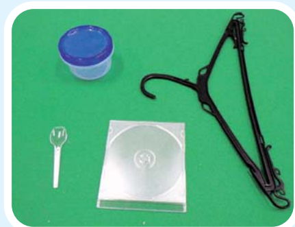
【プラスチックだけでできているもの】