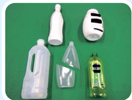
【ボトル・チューブ類】