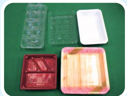
【パック・トレイ類】