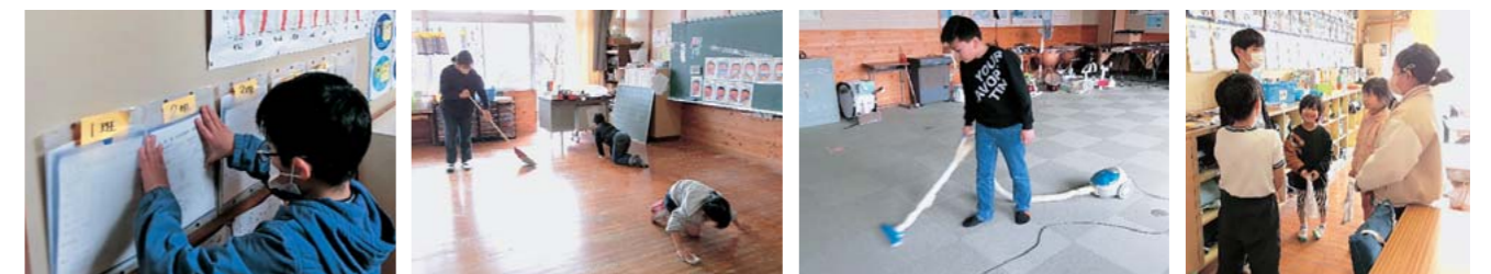
今日の掃除場所をチェック！ みんなで協力して掃除します。 家でも掃除をやっています！ 最後に振り返り

週に1回、全学年を縦割りですべてのクラスに分けて掃除を行います。高学年の児童がリーダーとなって、低学年に掃除のやり方を教えながら協力して掃除を進めます。リーダーの一人は、「蘇陽小は、みんな掃除が上手！教えなくても進んでやってくれる子が多い。」と話してくれました。