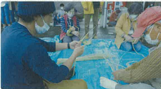
里山からの贈り物