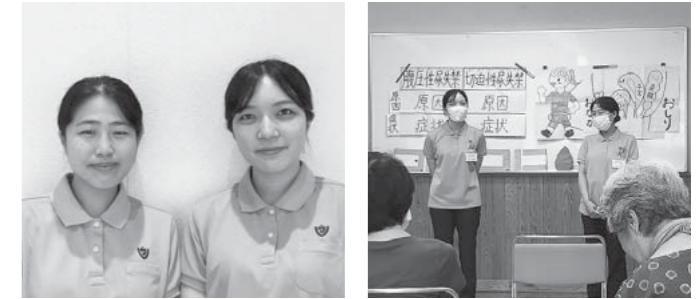
学生2名と健康教育実習の様子

7月～9月の内の約30日間、九州看護福祉大学看護学科・保健師課程の学生2名が山都町に実習で訪れました。学生から「山都町は、穏やかでとても居心地の良い場所でした。皆さんの優しさや愛情を沢山感じることができてうれしかったです。」「山都町は自然豊かで住民同士の繋がりが強く魅力のある町だと感じました。山都町での学びを生かして頑張っていきます。」と感想をいただきました。