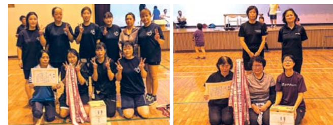
高級クラブレディースA