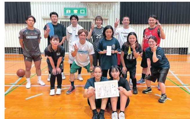
優勝した浜Bチームのみなさん