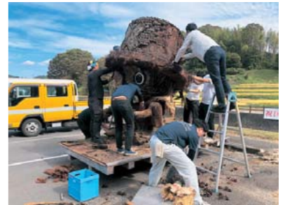
手作業での分別・解体