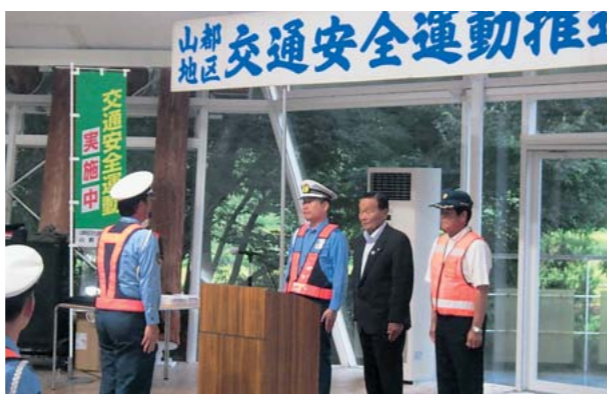
山都地区推進大会でのパトロール出発申告

9月21日から9月30日にかけて、秋の全国交通安全運動が実施されました。町では、交通安全運動山都地区推進大会、ハーレーパレードキャンペーンなどの各種交通安全啓発キャンペーンが実施されました。各種活動には、町の安全運転管理者協議会、自家用自動車協会、トラック協会、二輪車推進協議会、交通指導員、シニアクラブ、交通安全母の会、矢部高校生、矢部中学生、民生児童委員など多くの方々に参加し、住民の皆さまに交通安全の呼び掛けを行いました。