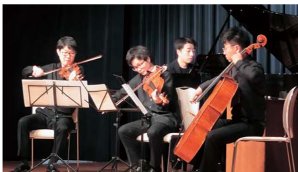
NHK交響楽団のみなさん

弦楽器とピアノが奏でる美しく迫力のある音色を聴き、来場者に優雅なひとときを与えました。