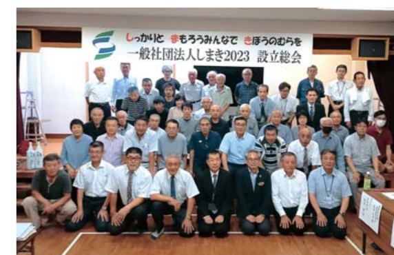
一般社団法人しまき2023