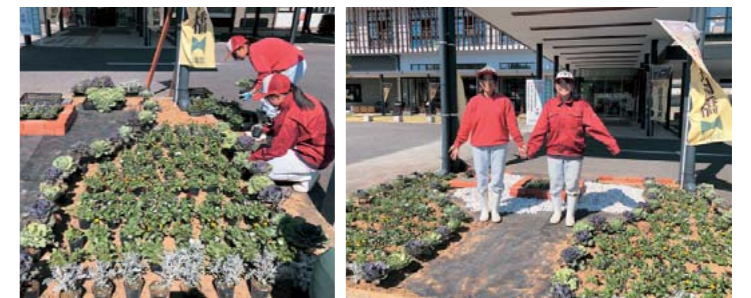
約200本の花苗を色などのバランスを考えながら配置・植栽しました!

花の配置や装飾も生徒自らがデザインし、同校で作られたピオラや葉牡丹などがきれいに植えられました。花壇の土は山都町シニアクラブ連合会やコンポストモニターの皆さんの協力を得てできた堆肥を利用しました。お近くにお越しの際は、是非、きれいになった花壇をご覧ください。