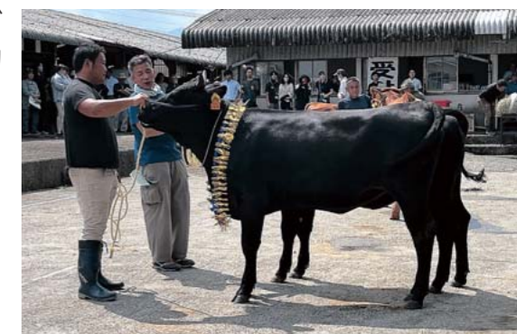
グランドチャンピオン うめ号 (株)Nishiyama farm