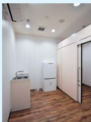
(ベビーケアルーム)