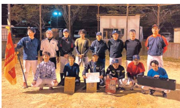
優勝した御岳体協のみなさん