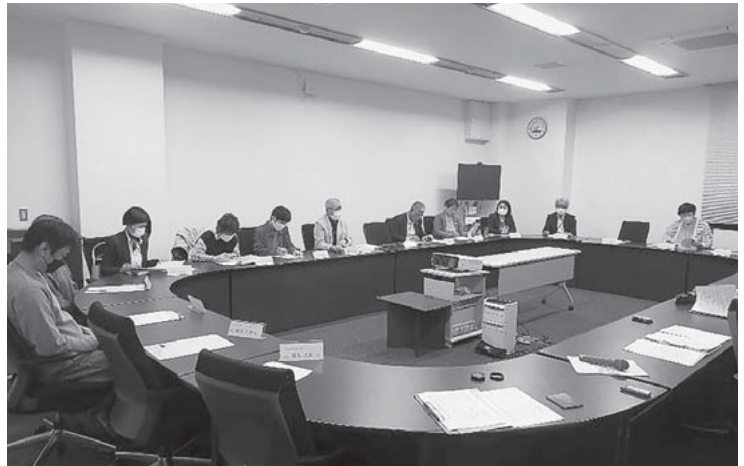
公立保育園のあり方委員会の様子

このような状況を踏まえ、町としては、抜本的な公立保育園のあり方を検討するべく「山都町公立保育園のあり方検討委員会」を設置しました。今後、委員会で話し合いを進めて意見を整理し、その内容を町長へ答申します。