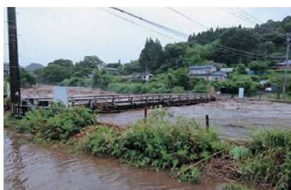
通潤橋芝生広場付近