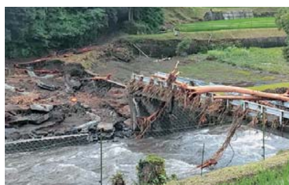
下川井野農道及び田んぼ

国道・県道・町道で通行止め等が発生しております。 通行の際は、指定された迂回路の利用にご協力をお願いいたします。