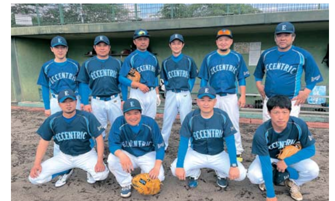
エキセントリックのメンバー

山都町の軟式野球チーム「エキセントリック」が5月20日から球磨郡で開催された日本マスターズスポーツ2023軟式野球熊本県大会に初めて参加しました。マスターズスポーツとは40歳以上の大会で県下22チームが参加しました。結果は惜しくも初戦敗退でしたが、今後の活躍が期待されます。