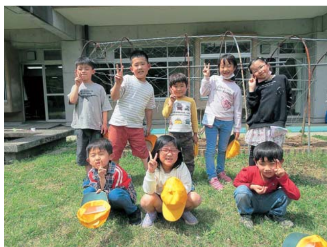
中島小学校1・2年生のみなさん