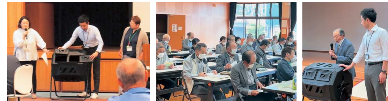
5/24 福祉会長合同研修会の様子

町では、昨年度策定した「SDGs2030基本目標」について巡回説明会を実施しますので、各地域で開催されるイベントやサロン等の予定があれば、以下の問合せ先までご連絡をお願いします。