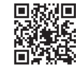
山の都のやおやさん 二次元コード