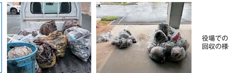
役場での回収の様子