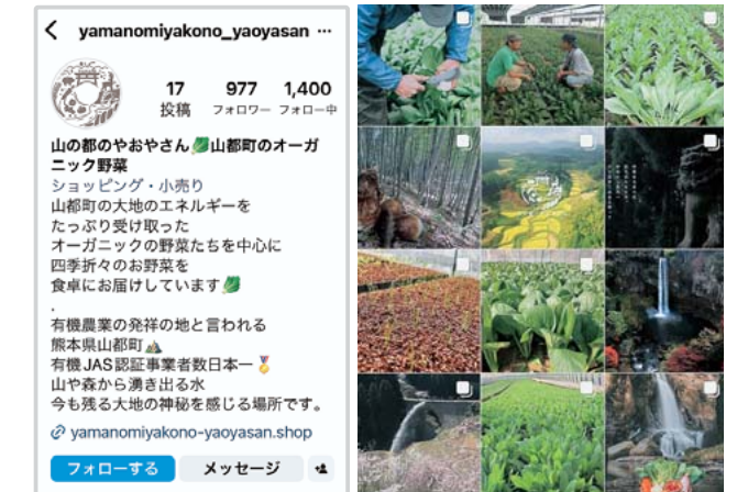
山の都のやおやさん Instagram

問合せ (出荷について) 株式会社 肥後やまと ☎ 72-0565 (サイトについて) 農林振興課 ☎ 72-1136