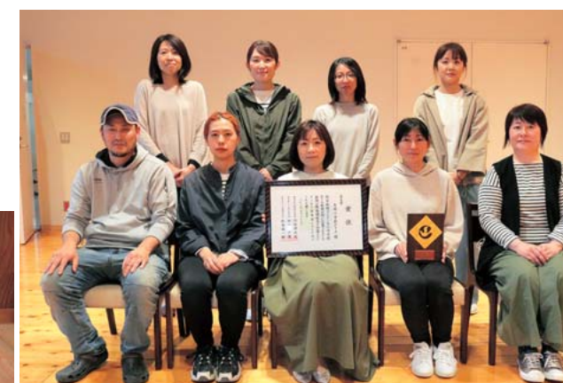
矢部小学校広報部のみなさん