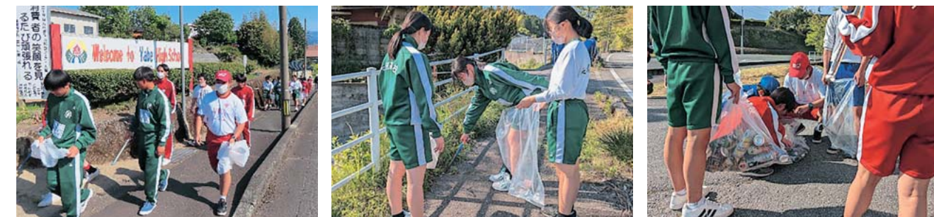
矢部高校清掃活動の様子