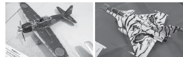
トムキャッツ作品

「熊本モデリングクラブトムキャッツ」所属の 愛好家たちが制作した精巧な航空機プラモデルを 展示します。