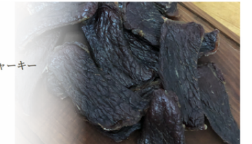
肉と塩だけで作る、シンプルなジビエジャーキーの開発