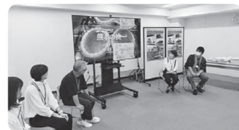
【くまもと暮らしセミナー ーくまもとに暮らす人のある1日を見てみたら意外と〇〇だった件ーセミナーのようす】

問合せ 空き家や移住・定住に関するお問い合わせは、お気軽にどうぞ。 山の都地域しごとセンター ☎72-9111 e-mail:yamato.shigotocenter@machi-y.jp