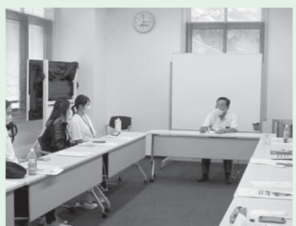
SDGs 体験研修の意見交換