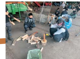
(株)山都興産で木質バイオ マスを学び薪割体験