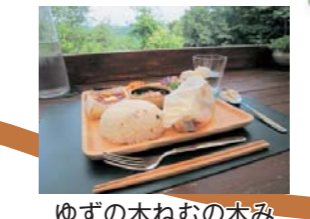
ゆずの木ねむの木み ずたまの木でランチ