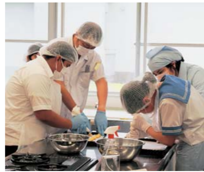
食農科学科 クッキー製造体験

食農科学科はクッキー製造体験を行いました。林業科学科はかどっこハートのくまモン製作、及びドローン操縦体験を行いました。普通科では探究活動の発表のあと、進学を中心として大学・公務員・専門学校など2年生から二つの類型に分かれ、様々な進路選択が可能であることなどをスライドで紹介しました。来年度もたくさんの新入生が矢部高校に入学していただけるよう、これからも本校の魅力の発信を続けていきます。