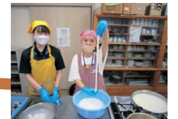
初めてのモッツアレラチーズ作り