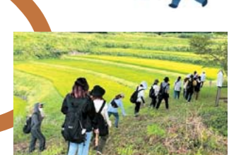
白糸第一地区をフットパス