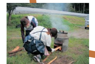
山都町の野菜を 使った夕食づくり かまどご飯に初挑戦