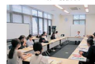
最後に梅田町長と意見交換