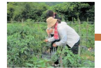
農事組合法人いちようで 集落営農を学び ピーマンの収穫