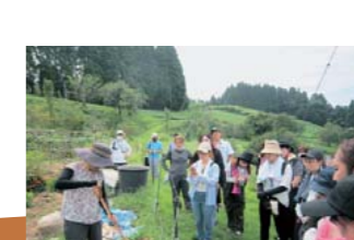
生ごみの堆肥化 を学びました