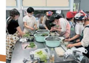
この日収穫した野菜も使っ て、ジビエ肉と 夏野菜の夕食