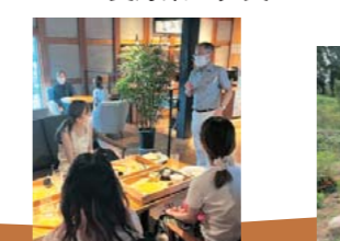
寛政蔵(通潤酒造) でランチ