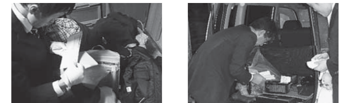
▲過去に熊本県と共同で実施した町税滞納者の自宅および車の捜索現場(実際の写真)