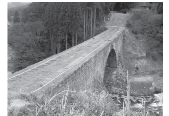
写真：白線を引いた橋上の様子