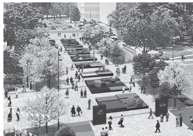
ニコライ・バーグマン氏の監修による大花壇イメージ(花畑広場)

問合せ 第38回全国都市緑化くまもとフェア実行委員会事務局 ☎ 096-328-2525