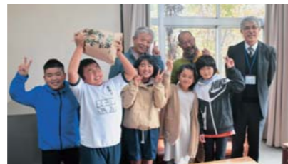
【清和小学校での無農薬米の贈呈式の様子】