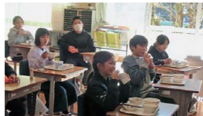
【清和小学校での給食の様子】