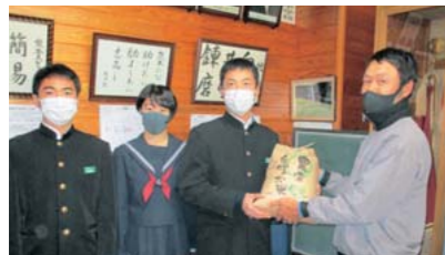
【矢部中学校での無農薬米の贈呈式の様子】

町では、有機農業の推進及び子どもたちへの食育の一環として、11月22日から学校給食への有機米の導入を行っています。環境に優しい栽培方法で作られた山都町の農産物について、子ども達に伝え、味わっていただきたいと考えます。