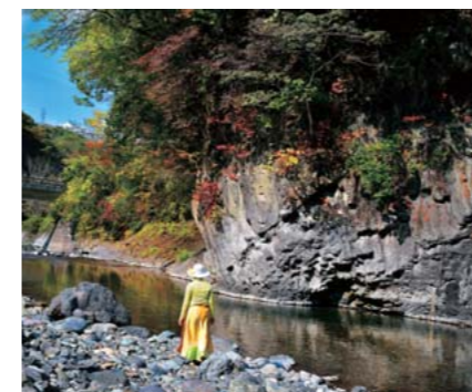
山の都賞 タイトル:「回想」