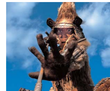
山の都賞 タイトル:「眼力」