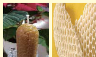
ミツロウキャンドル

熊本市西部環境工場のイベントにてミツロウキャンドル作り体験コーナーがあります。興味を持たれましたらぜひ遊びにおいでください。