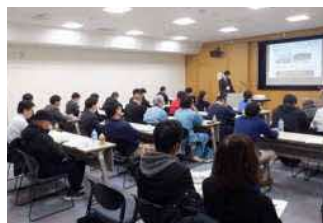
第2回セミナー(11月30日)