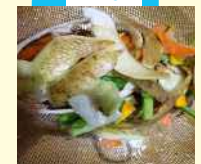
野菜の皮などはザルに入れて煮出して野菜だしに