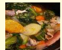
完成したポトフです