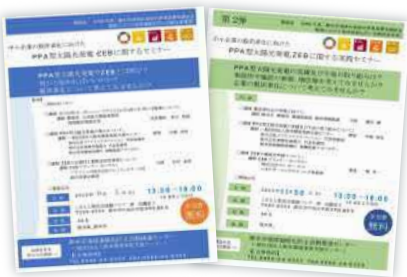
セミナーの参加者募集のちらし

環境省「令和5年度二酸化炭素排出抑制対策事業費等補助金(地域における地球温暖化防止活動促進事業)」の一環として、中小企業の脱炭素化に向け、PPA型太陽光発電やZEBをテーマとしたセミナーを2回実施しました。