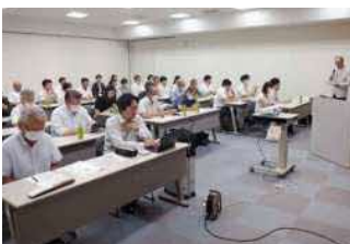
第1回セミナー(9月5日)

第2回(11月30日)は、PPA型太陽光発電の導入実績や今後の取組、事務所や施設を新築・増改築する際のZEB化補助金についてのセミナーで、36名の参加がありました。