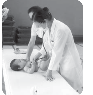
小児科医の診察の様子

乳幼児健診では、病気などの早期発見や安心して子育てできるようサポートを行っていますので、不安や心配ごとがあれば、お気軽に相談ください。