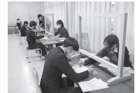
矢部高校での申請会の様子

ご希望があれば、職員が地域や職場に伺い、マイナンバーカードの申請会を開催します。少人数でも構いませんのでご相談ください。お時間、場所などすべてご希望に合わせて開催します。昨年度は、熊本県立矢部高等学校や、入佐地区、野尻地区で開催し、多くの方に申請いただきました。