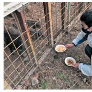
イノシシ誘引剤の反応実験 煎った米ぬか、クローブに手ごたえを感じた

2年生の獣害対策研究班では、箱罠での効率的な害獣駆除の研究を行っており、害獣を箱罠におびき寄せるための「誘引剤」の開発に取り組んでいます。研究では地域の方々のご協力を得ながら、情報収集や実際のイノシシによる誘引剤への反応実験結果などを発表しました。現在は、実際の罠でイノシシを捕獲する検証実験へと移りました。今後は、ICTを活用したスマート農業が行われている農家の方との連携により、実際に見回りをしなくてもイノシシが罠にかかったかどうか遠隔でわかる装置の導入や、カメラによるイノシシの反応の撮影を試み、実験の結果を踏まえて、より効果的な誘引剤の開発に結び付けたいと考えています。地域の課題解決の取り組みが地域貢献の一端となればと期待が膨らみます。