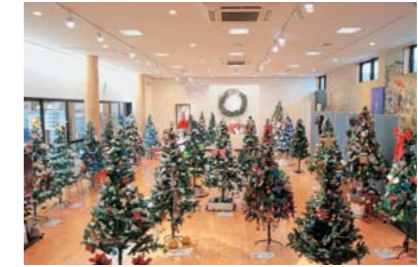
文化の森展示フロア