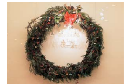
巨大なクリスマスリースも展示

12月1日（火）より、やまと文化の森（山都町観光文化交流館）では第1回クリスマスツリーコンテストを開催しています。各自治振興区が様々な工夫を凝らして装飾したツリーが、暖かな灯りで皆様をお待ちしています。