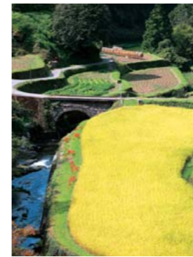
山の都賞 タイトル:「稲穂実る石橋の里」