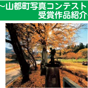
山の都賞 タイトル:「秋光の二宮金次郎」