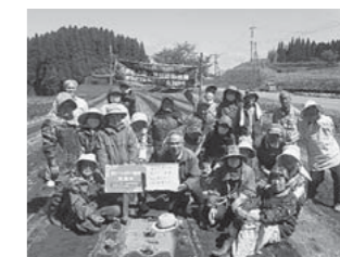
東竹原老人会の皆さん