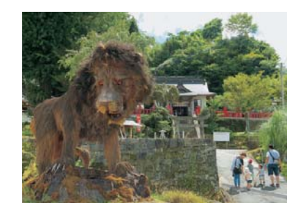
特選 タイトル：「獅子が見守る小一領神社」