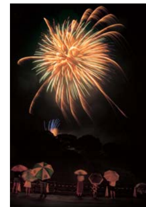
特選 タイトル：「雨天決行」