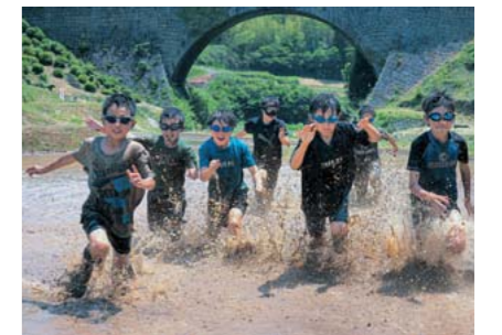
特選 タイトル：「山都の元気っ子」