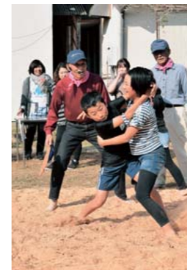
特選 タイトル：「仲良し相撲」