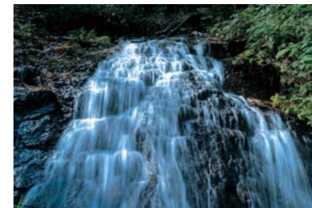
特選 タイトル：「清水の轟」