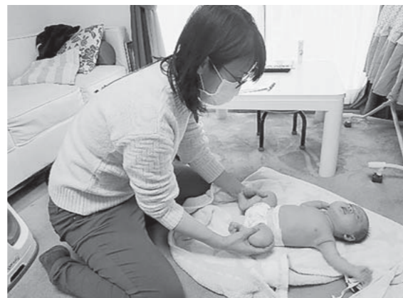
保健師による体の発達確認

訪問後も体重の伸びや離乳食など不安なことがあれば、町の保健師や栄養士が対応させていただきます。