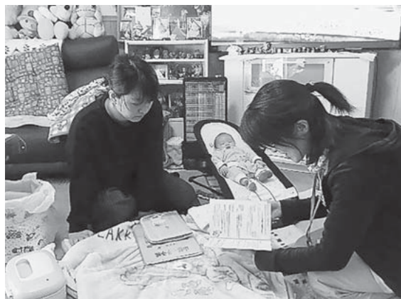
子育て支援センターの施設の紹介など

子育ての悩みや不安が少しでも軽くなるようにお手伝いさせていただきますので、まずは赤ちゃん訪問で保健師や子育て支援センタースタッフの顔を覚えてください。