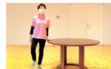
軽くひざを曲げて足を浮かせる。姿勢はまっすぐを意識する