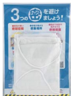
国から送られてくるマスクのイメージ

※国から配布されるマスクは無料で、送料の支払いや料金の支払いを求められることは絶対にありません!