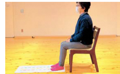
足の裏全体が床につく高さのイスに座り、タオルの端をかかとに揃える