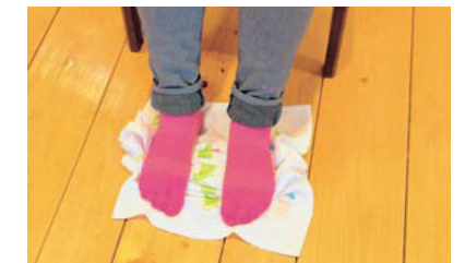
手前に集めたタオルは足の裏で押さえる。曲げて集めて・伸ばして…つま先にタオルの端が来たら終了!