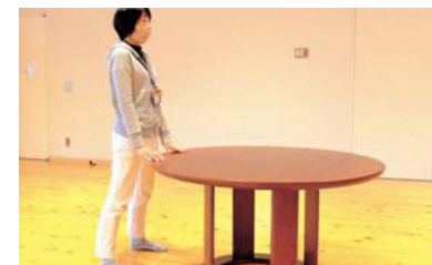
机やイスの背につかまり、足は肩幅より少し広めに広げて立ち、つま先は30度程開く