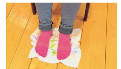
手前に集めたタオルは足の裏で押さえる。曲げて集めて・伸ばして…つま先にタオルの端が来たら終了!