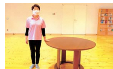
机など手を置いて体を支える。不安な場合は両手を机に向かい合い両手を置く