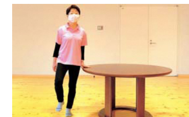
軽くひざを曲げて足を浮かせる。姿勢はまっすぐを意識する