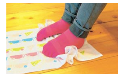
かかとが浮かないように気をつけ、足の指を折り曲げてタオルを手前にたぐり寄せていく