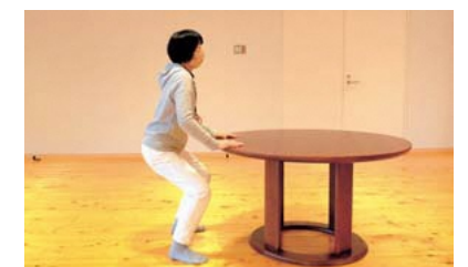
深呼吸をするペースで 5 回繰り返す。1 日に 3 回を目安に行う。