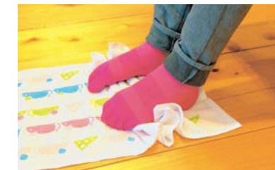
かかとが浮かないように気をつけ、足の指を折り曲げてタオルを手前にたぐり寄せていく