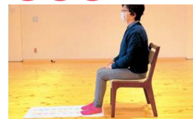
足の裏全体が床につく高さのイスに座り、タオルの端をかかとに揃える