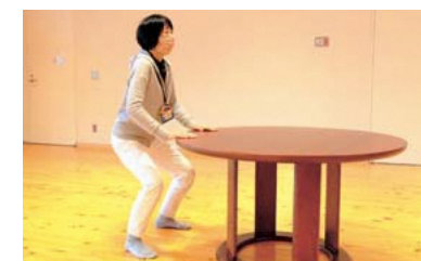
ゆっくりとおしりを後ろに引くように身体をしずめる。ひざはつま先と同じ方向に曲げる