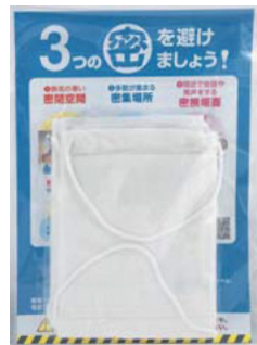
国から送られてくるマスクのイメージ

※国から配布されるマスクは無料で、配送料の支払いや料金の支払いを求められることは絶対にありません!