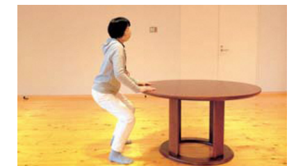
深呼吸をするペースで5回繰り返す。1日に3回を目安に行う。