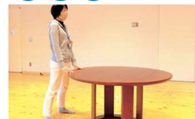
机やイスの背につかまり、足は肩幅より少し広めに広げて立ち、つま先は 30 度程開く