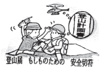
登山届 もしものための 安全切符