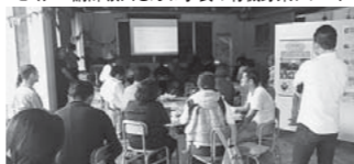
セミナー、写真展ともに参加者の注目の的になっていました