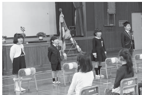
御岳小学校の入学式で元気にあいさつする平成30年度の新1年生4人

なお、答申では、統合の時期を「平成32年4月」とされていましたが、御岳小学校の来年度新入学児童が1