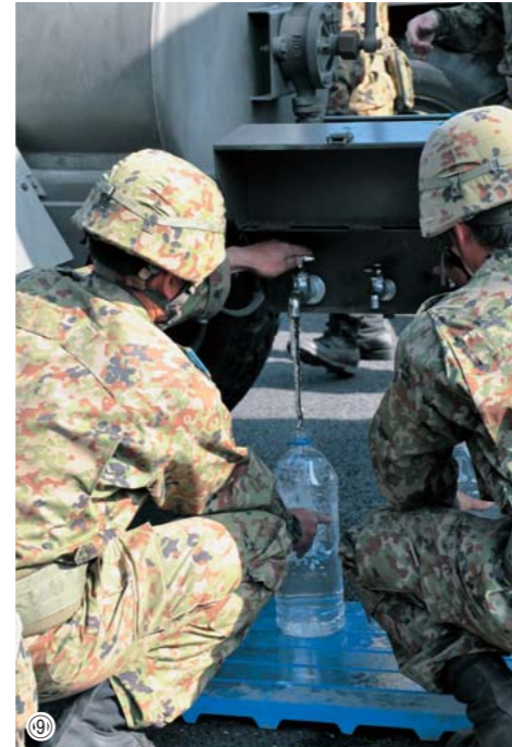
①日本赤十字病院（避難所訪問） ②新潟県医療チーム（避難所訪問） ③福岡県赤村（物資支援） ④⑦運び込まれる支援物資 ⑤兵庫県西脇市（物資支援） ⑥⑨自衛隊による支援（入浴・給水支援） ⑧岡山県吉備中央町（給水支援） ⑩茨城県龍ヶ崎市（避難所訪問） 全国各地からたくさんの方や団体が駆けつけ、山都町へ支援をいただいています。