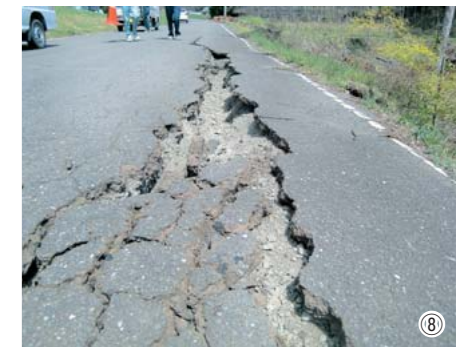
①通潤山荘（会議室） ②白小野地区 ③県道横野矢部線 ④津留線 ⑤今馬見原線（避難の様子） ⑥林道下山高畑線 ⑦津留柳線 ⑧原尾野大矢線 ⑨布田神社（記念碑） ⑩鬼の門線 山都町内の各地で土砂崩れや家屋の倒壊などたくさんの被害がありました。