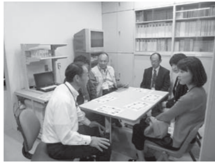
<科捜研所長による業務説明>