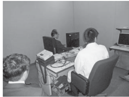
<ポリグラフ検査体験>