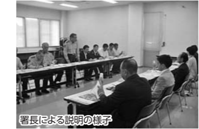
署長による説明の様子