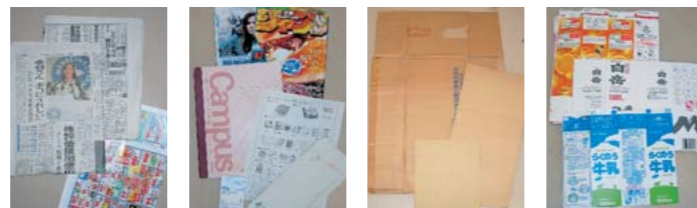
新聞 折込みチラシ 雑誌、本、ノート、封筒、カタログ、お菓子箱など 段ボール 牛乳パック 紙製パック