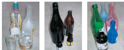
調味料ビン、酒類ビン、化粧ビン、ドレッシングビンなど 酒類ビン、化粧ビン、ドリンクビンなど 無色ビンと茶色ビン以外のビン 例) 青ビン・緑ビンなど