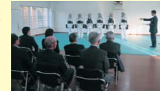
<逮捕術訓練の状況>