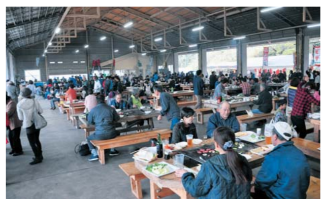
あか牛とワインを堪能しました