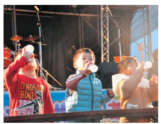
ラムネ早飲み競争

11月2日、J A阿蘇蘇陽野菜集荷場で「蘇ジョレニューボーとあか牛まつり」が開催されました。小雨交じりの寒い中、多くの来場者が足を運び赤牛やワインを堪能しました。10年ほど途絶えていたこのイベントですが、昨年と同様に復活し今年もまた大盛況を迎えました。 会場ではバーベキューの他にも、ライブ演奏や大根すりおろし大会、カレー早食い二人羽織など多くの個性的な笑いの堪えないイベントとなりました。