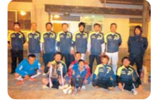
<2部>優勝 中島東部体協B