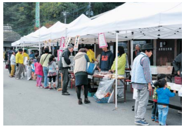
会場には多くの方がつめかけました

11月3日、道の駅「通潤橋」前でうまかもん祭が開催されました。当日は天気も良く、午前中から多くの来場者が詰めかけました。各店舗の多彩な出店があったほか、ハレーの試乗会なども行われました。