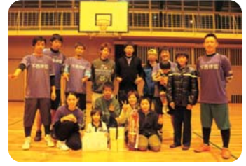
優勝 下矢部西部体協