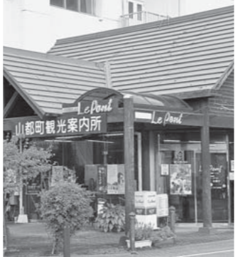
絵と筆文字約20点を展示します。

～7月ギャラリーのご案内～ A and G 平成26年8月1日(金) ～31日(日)まで 水曜日定休日