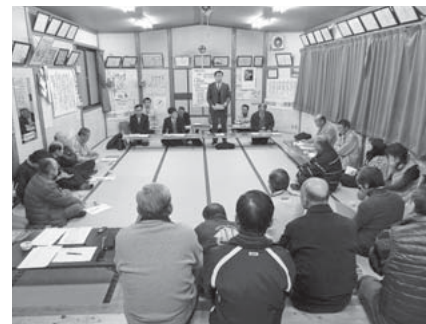
町長と住民との対話の様様

12月の下旬から『やまトーク(みんなの座談会)』を実施しています。自治振興区ごとに実施し、今後の町政の方針を町民の皆さまへ報告します。また、地域ごとに抱えている問題点や町政に対する意見などを直接住民の皆さまからいただき、今後の町政運営を担っていく上での重要な足掛かりとします。そのため、『やまトーク』ではより多くの生の声を必要としています。どなたでも参加できる、『やまトーク』。生の声を是非お聞かせください。