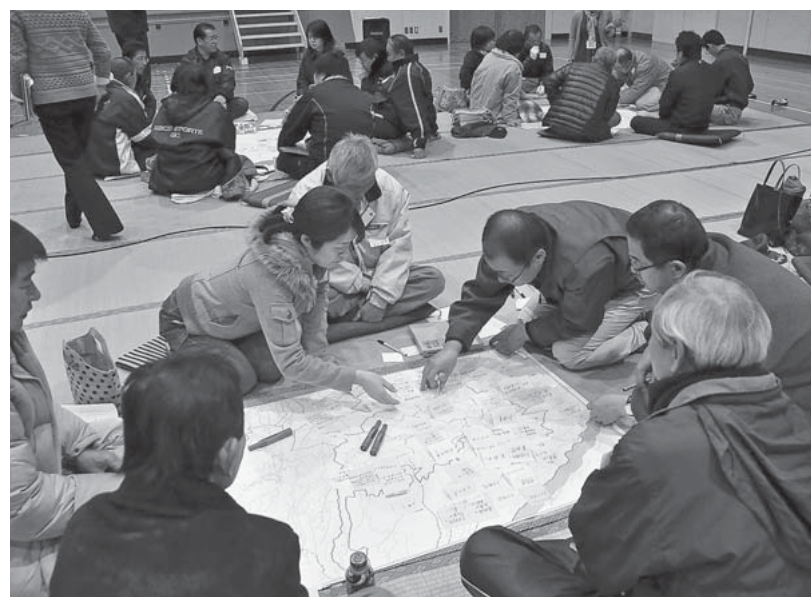
地域の資源(良いところ)を地図上に...

今後のまちづくりを進めていくうえでの方向性を示す「総合計画」。そのなかに、地域の将来像「地域ビジョン」を作成するため、自治振興区ごとに「やまと未来図ワークショップ」を開催しています。 地域ビジョンは身の周りにあたり前に存在するもの、地域に眠る資源