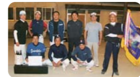
壮年の部 御岳東部