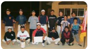
青年の部 御岳東部