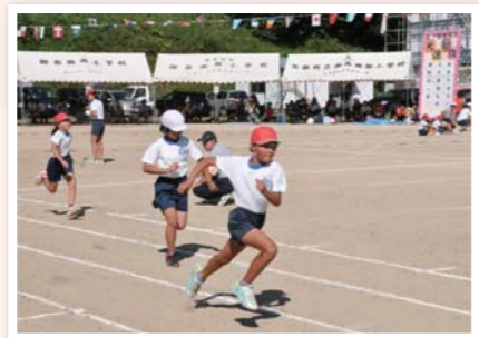
運動会で最も熱い徒競走