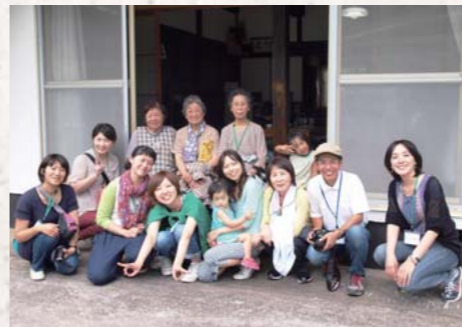
参加された皆さんと菅の方たち

9月7日・8日に「じゅんぐり舎」主催の「ゆるっと味わう山都生活」が開催されました。一泊二日のこの企画は、町外在住の女性参加者を中心に招き、山都町の人と自然に触れ、豊かな食を味わい、地域の暮らしの魅力を感じてもらおうものです。菅里山レストランでの昼食、ブルーベリーやトマトの収穫、山都町産の有機野菜を使った夕食作りなど、地元住民のみなさんとの心温まる交流が行われ、参加者からは「また来ます!」との声が多く聞かれました。