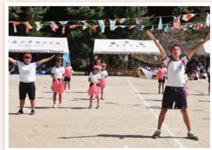
熱のこもった応援団