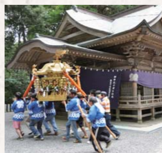
重い御輿を担ぎ、境内を全力疾走

9月21日、二瀬本神社で例大祭が開催されました。祭りでは神楽の奉納を始め、多くの催しが行われました。なかでも毎年、総代のくじによって担ぎ手を選び、神社の境内を3周走り抜ける御輿はこの祭りの一番の見どころ。1周することに神社の前で神楽が奉納され、その間は御輿をおろす事はできません。見物人が境内の周りで見守る中、今年も神楽を奉納する事ができました。 その他にも、蘇陽小学校児童による鼓笛演奏や二瀬本保育園児によるエイサー踊りの奉納のほか、神社内にある舞台でも数多くの催しが行われました。